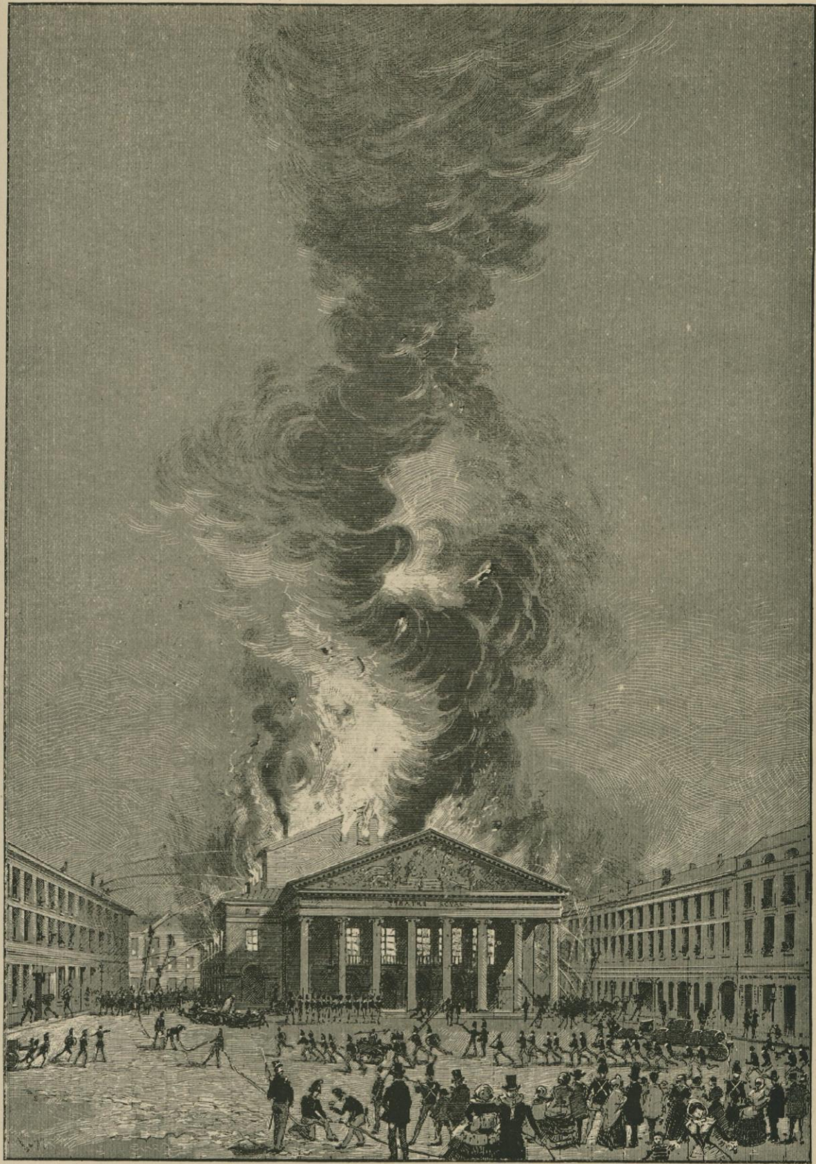
INCENDIE DU THÉÂTRE DE LA MONNAIE LE 21 JANVIER 1855. Dessin de Louis Titz, d'après une lithographie de l'époque.